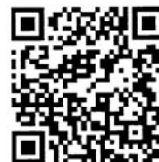
インターネット出願用 QR